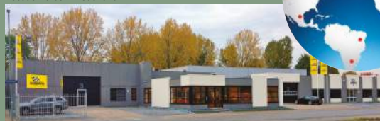
Locatie Bardahl Nederland